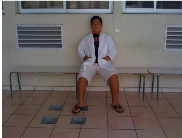
(Bâtiment D, couloir devant les salles de SPC)